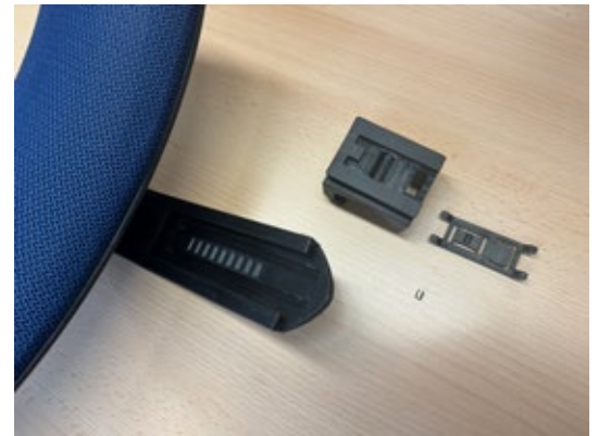
2. Kopflehne umdrehen, so dass die Einrast-Marken erkennbar sind