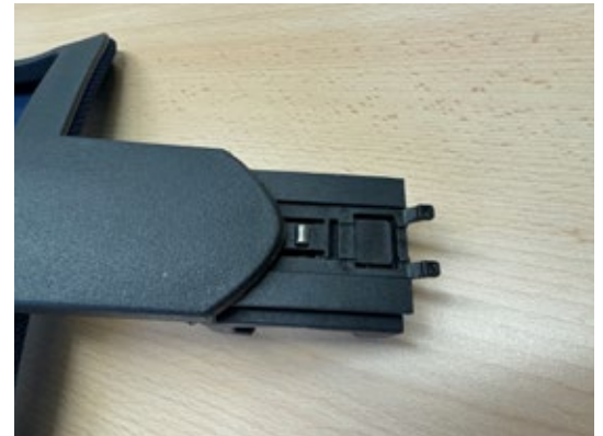
4. Lehne umdrehen und den zusammengesetzten Schlitten in die Schiene schieben. Auf den Zylinder achten, dieser fällt leicht raus. Solange schieben, bis der Schlitten einrastet.