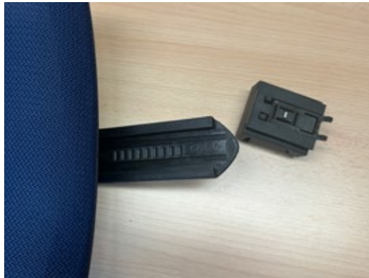
3. Klemmschlitten mit dem Zylinder in den Schlitten einsetzen.