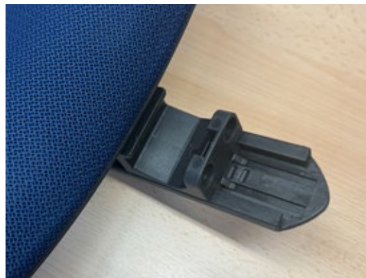
5. Schlitten muß schwer zu bewegen sein und das Einrasten des Schlitten ist deutlich zu hören sein.